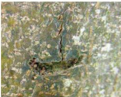
Schlitzartige, T-förmige Eiablagestelle

Während der zweijährigen Entwicklung im Holz bohrt die Larve einen aufsteigenden Gang. Dabei werden grobe Nagespäne ausgestoßen,