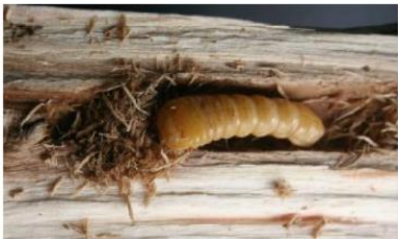
Auswurf grober Bohrspäne

welche sich an der Rinde, im Wurzelbereich oder in Astgabeln sammeln.