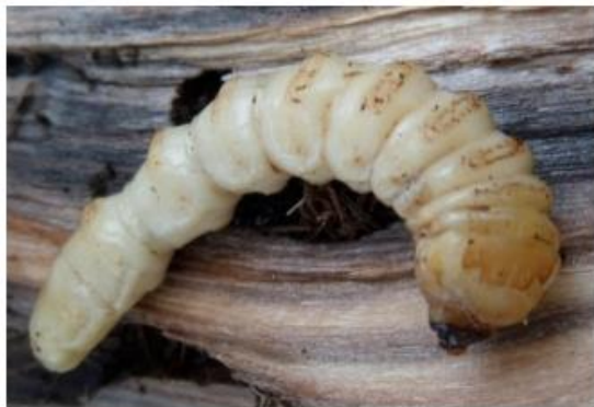
Larve mit Zinnenmuster auf dem Nackenschild

Die Larve des ALB ist ausgewachsen 30 bis 60 mm lang, cremeweiß hat keine Brustbeine und trägt ein markantes Nackenschild mit Zinnenmuster.