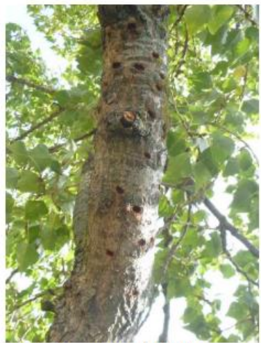
Stark befallener Baum mit zahlreichen Ausbohrlöchern

Im Anschluss verpuppt sich die Larve und der fertige Käfer bohrt sich durch ein kreisrundes Loch (ca. 1 cm Durchmesser) nach draußen. Jetzt kann es an unverholzter Rinde und an Blattstielen zu einem Reifungsfraß kommen.