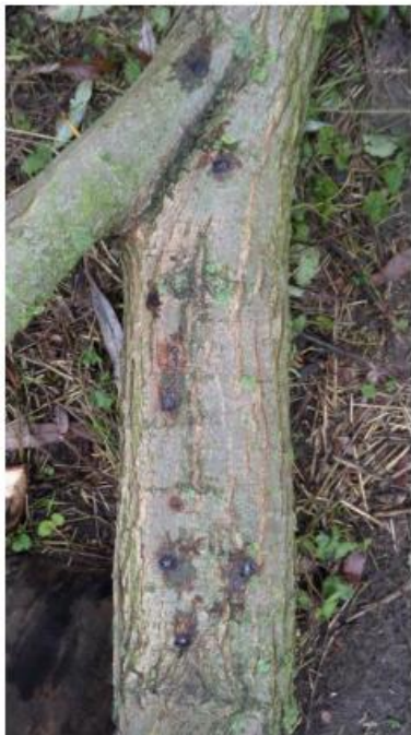
Frische Eiablagestellen mit Saftaustritt