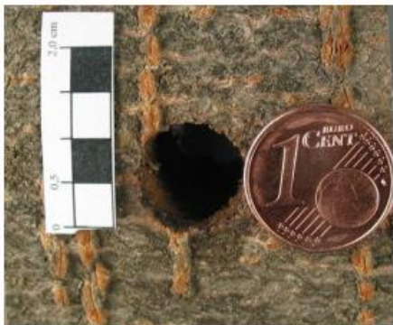
Ausbohrloch: 10 mm Durchmesser

welche sich an der Rinde, im Wurzelbereich oder in Astgabeln sammeln.