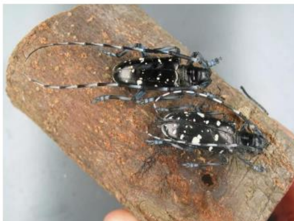
Adulte Käfer: oben Männchen, unten Weibchen

Der Käfer selbst ist ein 1,7 bis 3,9 cm (ohne Fühler) großer schwarzer Bockkäfer mit weißen bis goldenen Flecken und glänzenden Flügeldecken. Markant sind die kräftigen Fühler, die 1,5 bis 2,5 mal so lang wie der Körper sind.